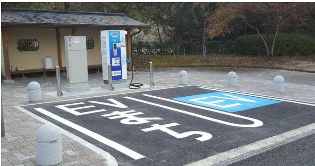
急速充電設備 整備イメージ (E3 九州自動車道 玉名 PA 下り線)