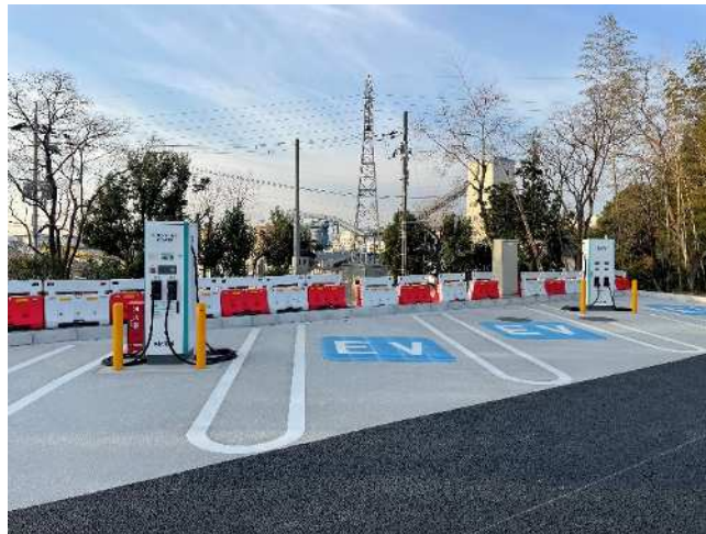
急速充電設備 整備イメージ (参考:E1 名神 桂川PA 下り線)