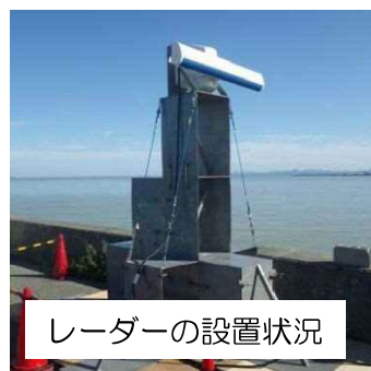
レーダーの設置状況