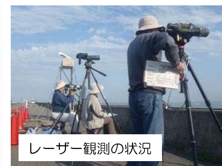
レーザー観測の状況