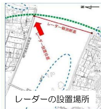
レーダーの設置場所