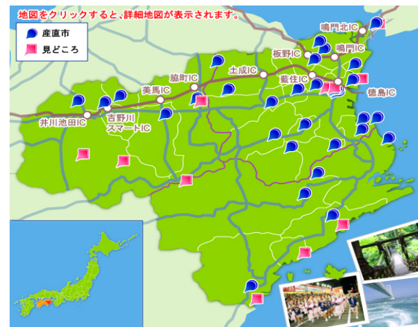
サイト「近いよ！徳島」