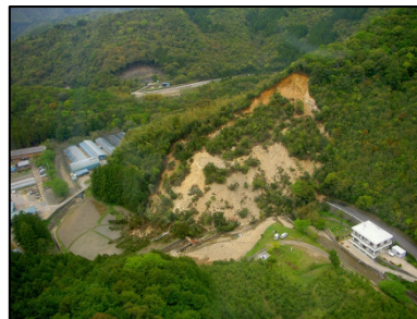
防災ヘリによる被災状況確認