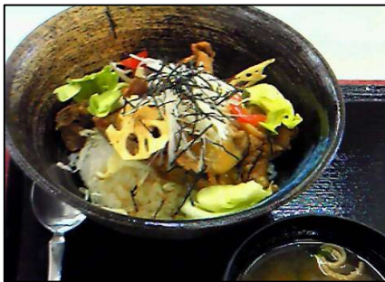
ゆず味噌豚丼 (上板サービスエリア)