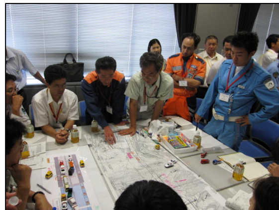
県機関と合同の高速道路災害図上訓練