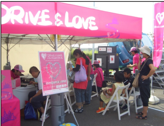
DRIVE & LOVE交通安全啓発活動