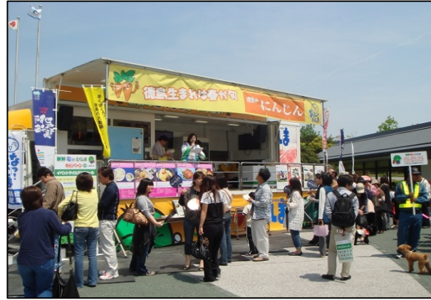
上板サービスエリア