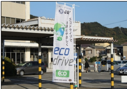
エコドライブキャンペーン