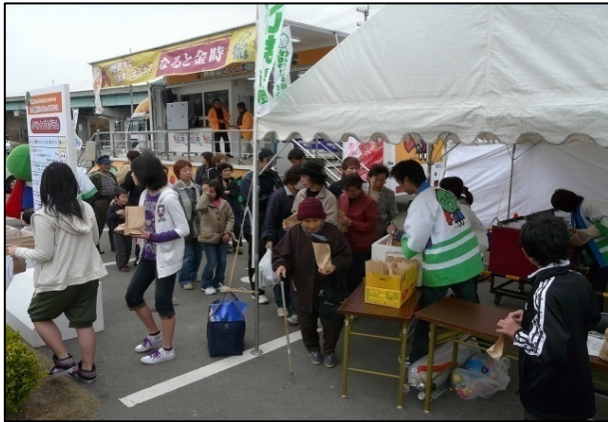
吉野川ハイウェイオアシス