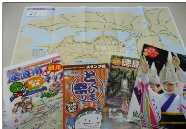
ドライブ旅行の広報展開