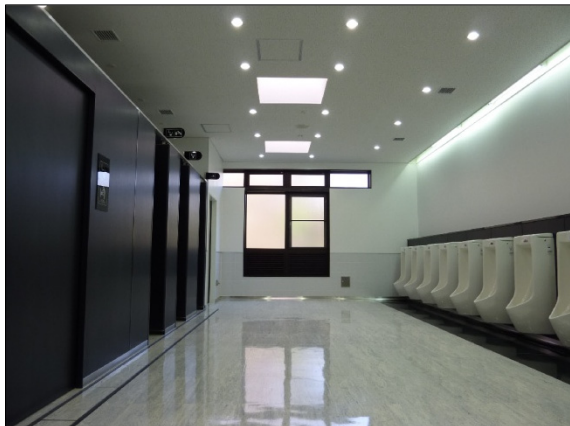
SAお手洗いににおけるLEDの活用

※徳島県では県内に世界有数のLEDメーカーが存在する優位性等を活かして「LEDバレイ構想」を策定し、光関連産業の集積促進を図っている。