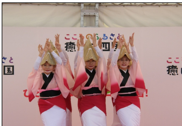
観光PRイベントの開催

④県観光情報サイト「阿波ナビ」による広報展開(徳島県内の観光地、イベント、宿泊施設等の詳しい情報が確認できます)