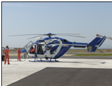
県防災ヘリ「うずしお」