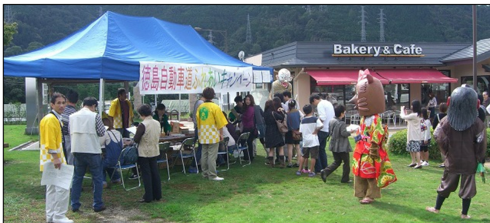
徳島自動車道ふれあいキャンペーン (徳島道 吉野川サービスエリア)