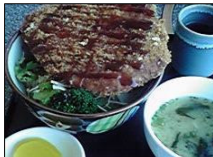
まけまけ丼 (吉野川ハイウェイオアシス)

○サービスエリア等において、県のPRトラック「新鮮 なっ！とくしま」号を展開し、県内外のお客様へ、物産・観光・文化「まるごと徳島」の情報発信を行います。