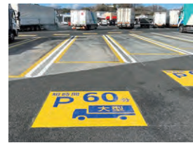
短時間限定駐車マスの実証実験

高速道路の更新・進化を実施するために、2023年5月、道路整備特別措置法及び独立行政法人日本高速道路保有・債務返済機構法が改正されました