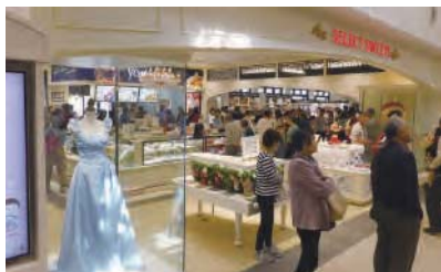
宝塚歌劇グッズの展示でお出迎え

宝塚市中心部の南欧風の景観をイメージした外観、宝塚歌劇グッズや宝塚が生誕地である手塚治虫のキャラクターグッズの販売、イベント開催など、地域の魅力を発信し、ご来店いただいたお客さまに宝塚らしさを満喫していただける施設となっております。