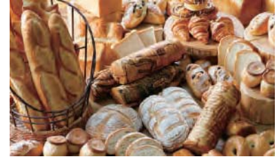
自家製天然酵母を使用したナチュラルベーカリー「森のパン」