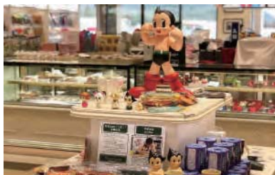
手塚治虫のキャラクターグッズ販売