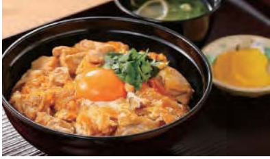
「西谷食堂花ぐるま」丹波黒どりの親子丼

地元食材を使用したお食事メニューの他、西日本の高速道路で初出店となる店舗や、関西の名産品の販売など多種多様な品揃えで皆さまをお待ちしています。