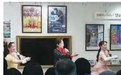
宝塚歌劇団OGによるショー