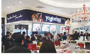
西日本の高速道路では初出店となるスイーツブランド「yogorino(ヨゴリーノ)」