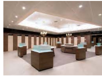
空きブースが一目でわかるトイレ

空きブースが一目でわかる「パノラマ配置」を採用しており、混雑時にも円滑・快適にご利用いただくことができます。また、様々な用途に応じたトイレ（ファミリートイレなど）、パウダーコーナー、トイレの待合スペースの設置など、お客様の様々なニーズにお応えするとともに、清潔感とくつろぎを感じられるようデザインにもこだわりました。