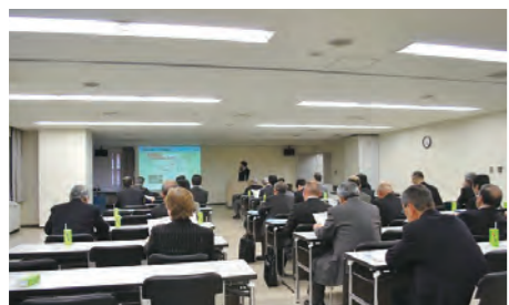
事業説明会(地元・関係自治体説明会)

高速道路を新設・改築する際には、地元自治体や警察、公共施設の管理者などの各関係機関や、計画道路の沿道地域の皆さまと入念な協議を重ねたうえで事業を進めています。