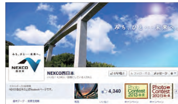
Facebook ⑧ 高速道路開通や工事進捗の情報、SA・PA情報を週3回投稿。「いいね!」数は4,100件(2014年3月末現在)

2014年度も引き続きお客さまからのご意見・ご要望やアンケート結果、ウェブサイト分析結果を踏まえて、さらなる料金検索機能の充実など、お客さまのニーズが高い情報を中心にウェブサイトの改良に努めます。