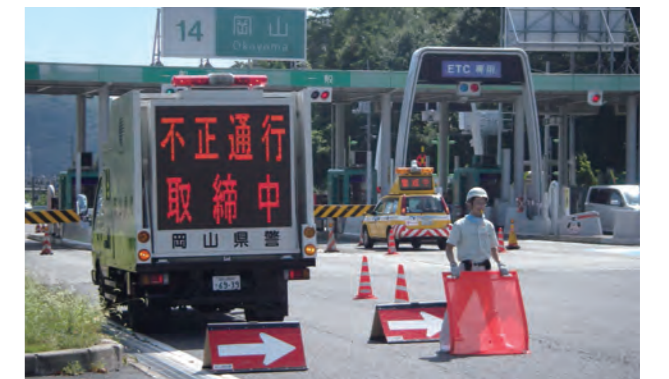
料金所での立哨監視を強化。警察と連携した取り締まりも推進