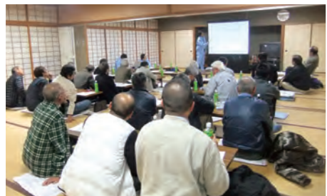
写真や完成予想の図なども活用するなど、わかりやすい説明を工夫した設計協議

また、説明会や設計協議 ④ の場でいただくご意見については、設計や計画に可能な限り反映させるよう努めています。