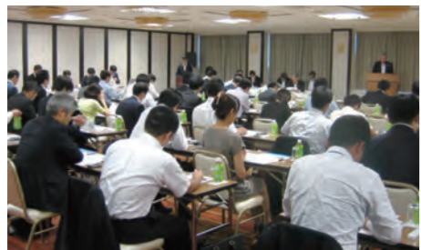
2013年7月19日の事業説明会

当社では、毎年7月頃に、東京で事業説明会を開催し、投資家や金融機関の皆さまにご出席いただいています。