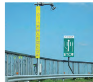
「お知らせアンテナ」を設置し、ETCカード未挿入等による未精算通過を防止

また、毎年「不正通行対策強化月間」を設けて、SA・PA、料金所などへのポスター・チラシの掲示や、高速道路上への看板・横断幕の設置、ラジオCM等を通じた告知、