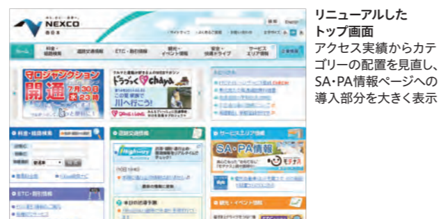
リニューアルしたトップ画面 アクセス実績からカテゴリーの配置を見直し、SA・PA情報ページへの導入部分を大きく表示

2013年度はトップ画面をリニューアルしました。お客さまからのご意見・ご要望やアンケート結果等を画面の配置に反映させた結果、1日あたり約51万件のアクセスをしていただきました。特にお客さまから要望の多かった、料金検索サービスのETC ⑦ 割引料金表示や、高速道路開通情報の見直しをしました。また、スマートフォン用のウェブサイトをリニューアルするなど改良を随時進めています。