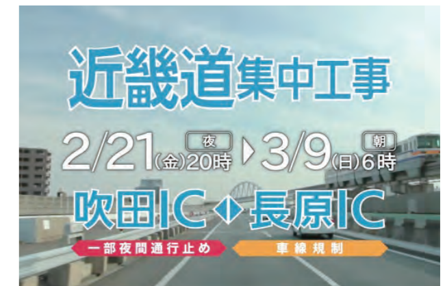
近畿道集中工事をお知らせする、テレビCM

ウェブサイトやリーフレットについては、お客さまが工事情報を詳細に知ることができる広報手段であるため、よりわかりやすく見やすいように心がけるとともに、集中工事の必要性や実施することでの利点なども含めてご理解いただけるよう内容の充実を図っています。