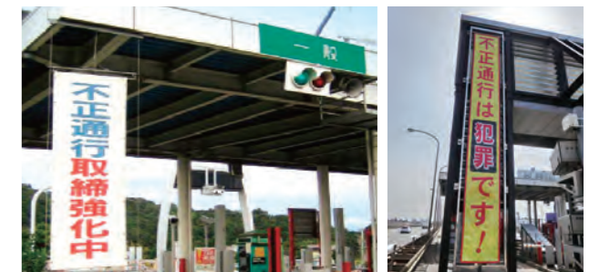
「不正通行対策強化月間」にはSA・PA、料金所などへのポスター・チラシの掲示や、高速道路上への看板・懸垂幕等の設置、ラジオCM等を通じた告知などの啓発活動を実施

今後も「不正通行は断固許さない」という毅然とした態度で、悪質な不正通行の分析調査に注力するとともに、警察の捜査にも積極的に協力し、その撲滅を目指していきます。