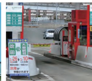
不正通行を防止する開閉バーを一般レーンにも設置

警察との合同取り締まりなどを実施し、ETCの利用方法を含めた不正通行事前防止の啓発活動も行っています。こうした取り組みによって、不正通行件数は年々減少しています。