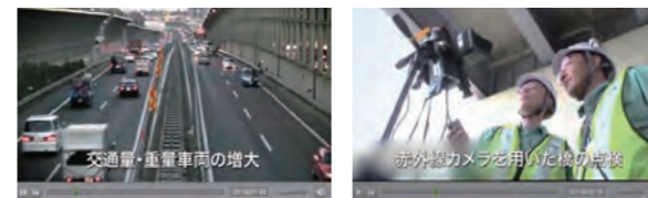
高速道路更新計画の動画

当社では2013年度、大規模更新や大規模修繕に取り組んでいくことの必要性についてご理解頂くため、高速道路の損傷の原因や補修状況、そして点検技術の進展について動画を掲載しました。お客さまから月約16,000件のアクセス(2014年3月実績)をいただいています。