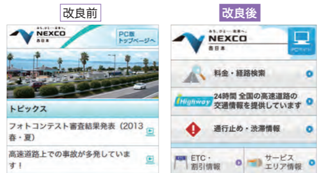
スマートフォン用ウェブサイトのトップ画面

2014年度も引き続きお客さまからのご意見・ご要望やアンケート結果、ウェブサイト分析結果を踏まえて、さらなる料金検索機能の充実など、お客さまのニーズが高い情報を中心にウェブサイトの改良に努めます。