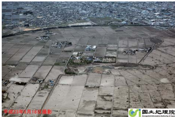
平成23年6月18日撮影 活動地域の被害状況(仙台東IC付近)

主に、家屋内外の土砂撤去、瓦礫の分別および撤去を実施。雨天時には写真等の漂流物整理も行いました。