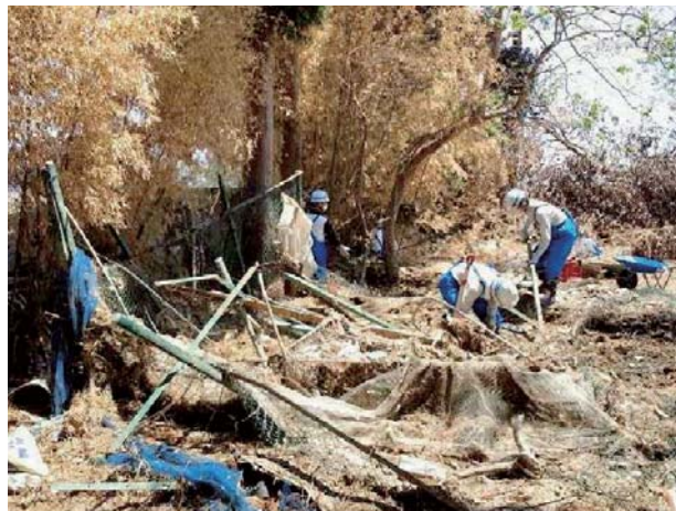
活動例(農地の片付け)