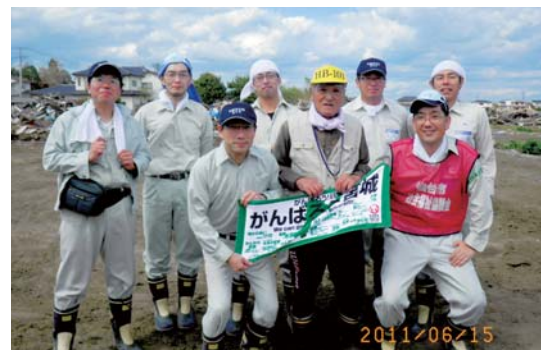
作業終了後に依頼者の方と(前列右端が本人)

最後に、私たちの背中を押し、送り出してもらった会社へ感謝しています。今回の経験を業務の中で生かしていくとともに、他の社員に語り伝えていくことも私たちの役割と認識しています。