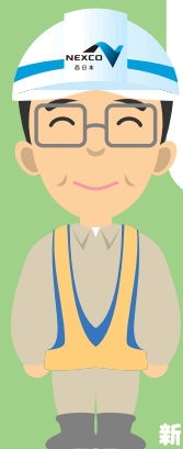
新しい道路をつくる人

高速道路はみんなの暮らしを便利で豊かにするんだ。僕たちはこれからも世界に誇れる高い技術で新しい道路をつくっていくね。