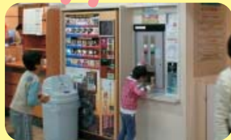
リラックスしていただくための 給茶サービス