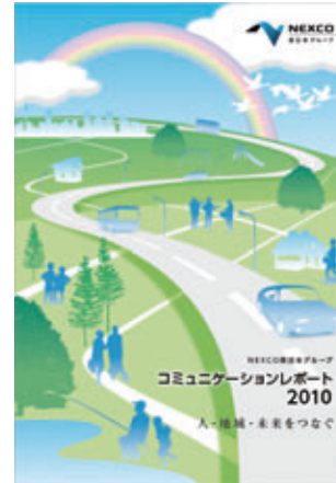
冊子版(ストーリー編)

http://corp.w-nexco.co.jp/corporate/csr/promote/