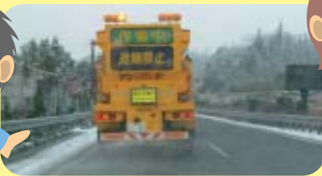
こおりにくくするため塩をまく作業車