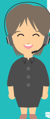
電話で相談を聞く人

高速道路について分からないことや知りたいことがあったら私たちに聞いてね。24時間、電話で分かりやすくお答えします!