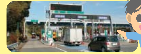
料金所をスムーズに通過できるETCゲート

高速道路では、事故や渋滞、悪天候などの影響がないときはほぼ同じスピードで自動車を走らせることができるんだ。これに対して、一般道路では信号や踏み切りなどがあるから、どうしても止まったり、発進したりが必要になるんだ。自動車は一定の速度で走った方が、燃料や排気ガスの量を抑えられるから、高速道路を利用したほうが空気を汚さないんだよ。