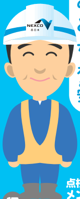
点検やメンテナンスする人

点検とメンテナンスは、高速道路にいたんだところがないか調べて、あればちゃんと直すという仕事だよ。僕たちが高速道路の健康を見守っているから安心してね。