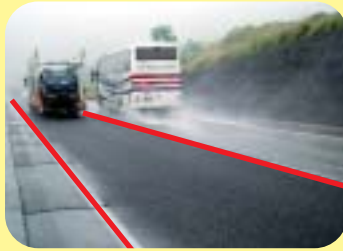
雨の日の舗装の様子 (左側が工夫した道路)