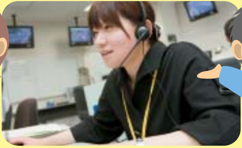
24時間、専門のオペレーターが対応