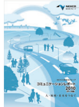
ウェブ版(データ編)