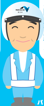
パトロールする人

パトロールは高速道路で事故が起きたり、何か物が落ちていたら、すばやく危険を取り除く仕事だよ。僕たちがパトロールして道路の交通安全をサポートするよ。