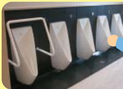
エコトイレ(節水型便器)