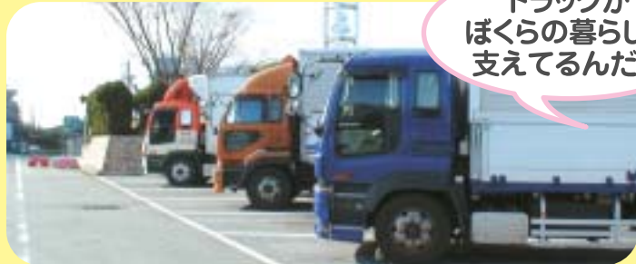
サービスエリア・パーキングエリアでの駐車の様子