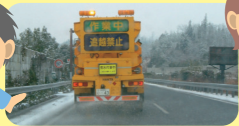
こおりにくくするため塩をまく作業車