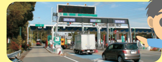
料金所をスムーズに通過できるETCゲート

高速道路では、事故や渋滞、悪天候などの影響がないときはほぼ同じスピードで自動車を走らせることができるんだ。これに対して、一般道路では信号や踏み切りなどがあるから、どうしても止まったり、発進したりが必要になるんだ。自動車は一定の速度で走った方が、燃料や排気ガスの量を抑えられるから、高速道路を利用したほうが空気を汚さないんだよ。