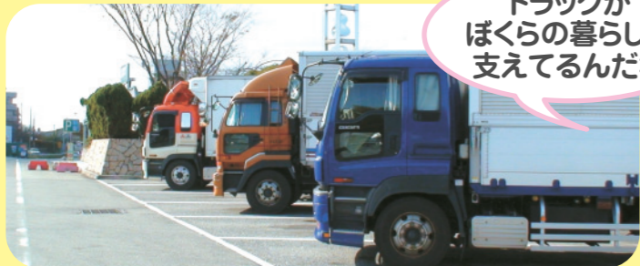
サービスエリア・パーキングエリアでの駐車の様子