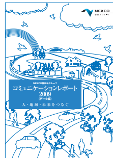
ウェブ版(データ編)

http://corp.w-nexco.co.jp/corporate/csr/promote/