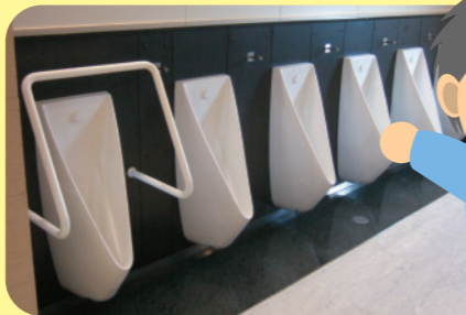
エコトイレ(節水型便器)