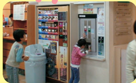
リラックスしていただくための 給茶サービス