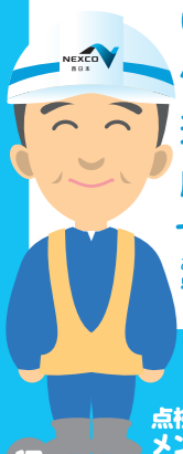
点検やメンテナンスする人

点検とメンテナンスは、高速道路にいたんだところがないか調べて、あればちゃんと直すという仕事だよ。