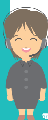
電話で相談を聞く人

高速道路について分からないことや知りたいことがあったら私たちに聞いてね。24時間、電話で分かりやすくお答えします！