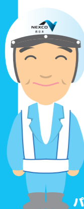
パトロールする人

パトロールは高速道路で事故が起きたり、何か物が落ちていたら、すばやく危険を取り除く仕事だよ。