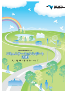
冊子版(ストーリー編)

私たちの事業活動をまとめたものを、冊子とウェブで紹介しています。冊子版は無料でお手元までお届けいたします。ウェブ版(PDF)は、下記アドレスからダウンロードできますので、ぜひご覧ください。