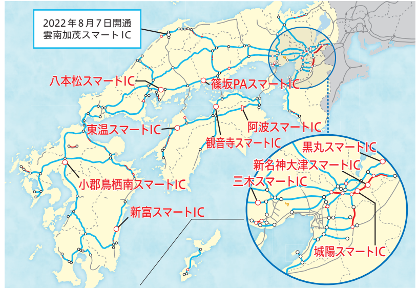
建設事業中スマートIC 11カ所 (名称は仮称を含む)