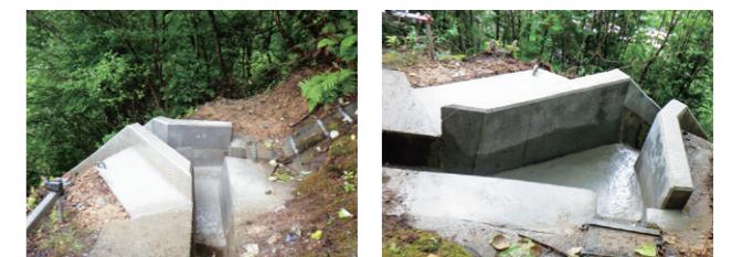
強化後の縦溝と集水ます

過年度の降雨災害の発生事例を分析すると、のり面については、排水構造物が直接関与した崩壊が約半数を占め、さらに、そのうちの約半数が縦溝や集水ます等の合流部で発生しています。これらを踏まえ、高速道路リニューアルプロジェクト(P.15-16)の中で、のり面の排水構造物の大規模修繕に取り組んでいます。