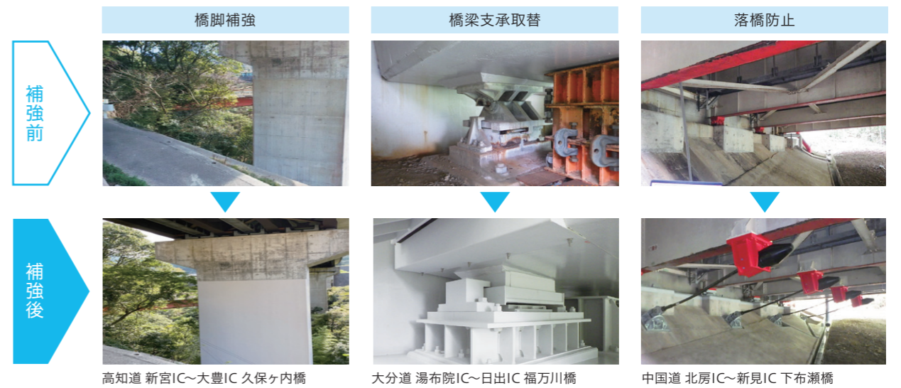
高知道 新宮IC~大豊IC 久保ヶ内橋

南海トラフ地震などの大規模地震が発生した際に速やかに高速道路を機能回復できるよう、耐震補強対策を推進しています。