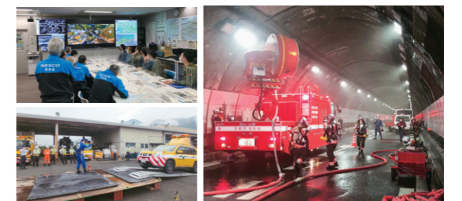
グループ会社や関係機関との合同による災害対応訓練

当社は災害対策基本法に基づく指定公共機関に指定されています。社会インフラを担う責任として、関係法令に基づき、道路保全や災害時の交通機能確保等の社会的役割を果たすため、防災業務計画等の社内規定整備や社内外での防災訓練等、ソフト面の災害対応力についても日々強化しています。