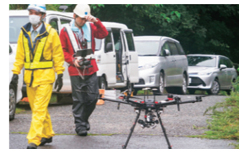
ドローン活用による迅速な現地状況確認