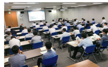
降雨出水期前の防災会議

激甚化・頻発化する集中豪雨・台風や地震等の自然災害に対して、引き続き、防災・減災に資する4車線化事業や耐震補強等の対策に取り組むとともに、災害が発生する前の通行規制措置やお客さまへの情報発信、災害が発生した際の速やかな通行止めや応急復旧に向けて、グループ丸となって取り組みます。