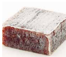
「高山堂 生きんつば」