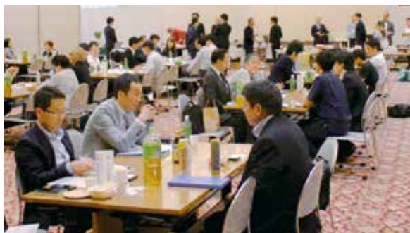
広島地区ハイウェイ商談会の様子