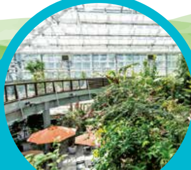
なかやまフラワーハウス