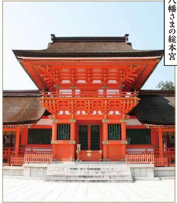
八幡さまの総本宮

神社の創建は奈良時代以前までさかのぼり、神亀2(725)年に現在の場所に社殿が建てられ、今年(2025年)は御鎮座1300年の節目を迎える。また、祭事に皇室からの使い(勅使)が派遣される勅祭社の一つであり、秋には10年に一度の臨時奉幣祭(勅祭)も行われる予定。