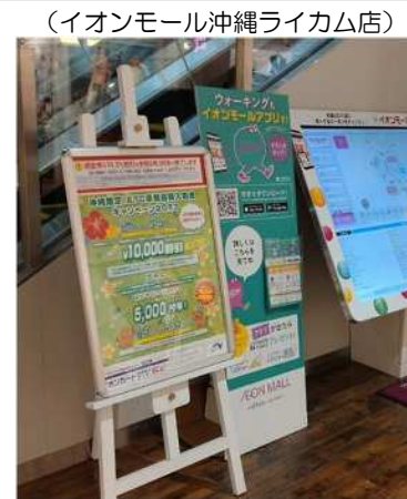
④、⑤キャンペーンチラシ・ポスター