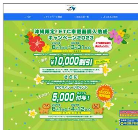
③車載器購入助成CP特設サイト