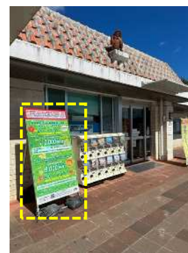
⑪看板設置状況 (中城PA)