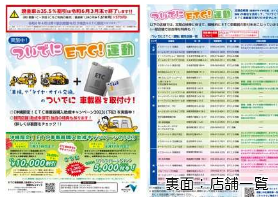
<料金所配布チラシ>