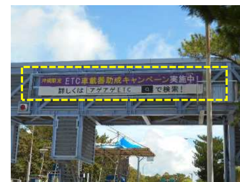
⑬横断幕設置状況 (金武IC)