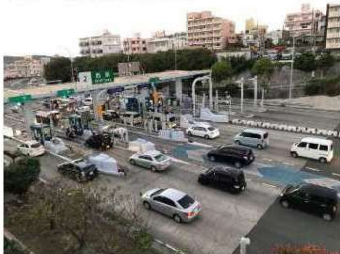
・西原料金所における出口渋滞状況