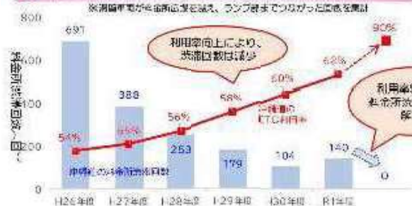
② 沖縄道のETC利用率と料金所渋滞回数 ※ 推移 ※調査年度が料金所混雑を減らし、ランプ部までつながった状態を意味