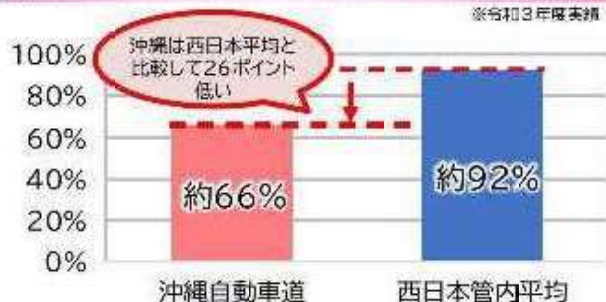
① 沖縄道のETC利用率（西日本管内平均との比較） ※令和3年度実績