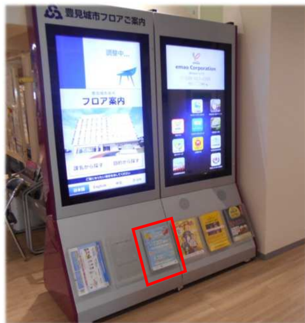
豊見城市庁舎 (チラシ設置状況)