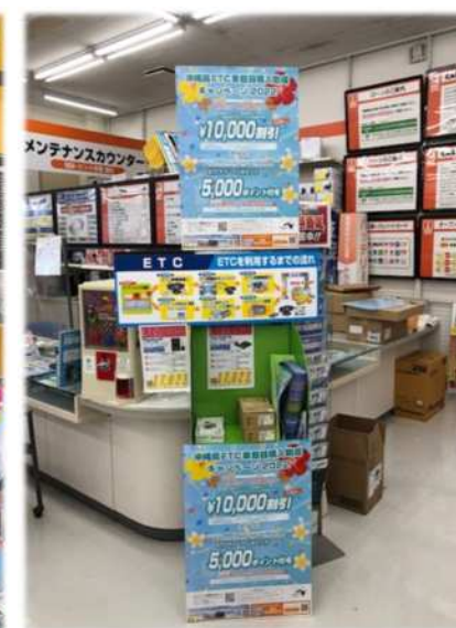
キャンペーン取扱店舗 (左: チラシ、右: ポスター)