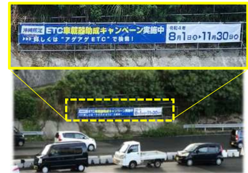
⑪ 横断幕設置状況(西原IC)