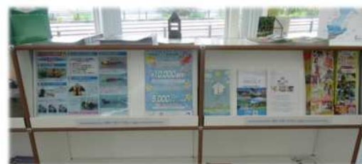
道の駅 ぎのざ (チラシ設置状況)