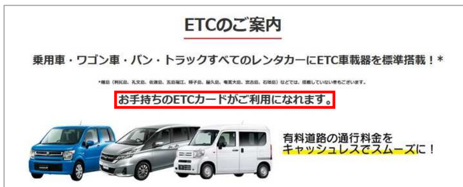
ETCカード持参周知例(レンタカー会社HP)