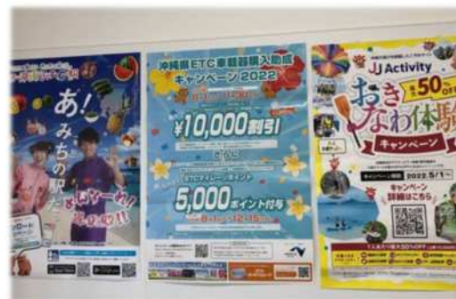
道の駅 かでな (ポスター設置状況)