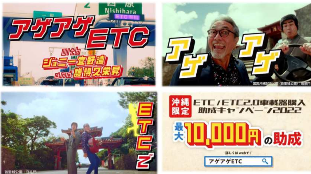
⑥テレビ CM、⑧YouTube CM