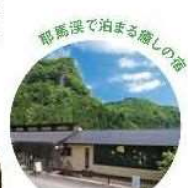
耶馬溪で泊まる癒しの宿 小さなお宿 つきのほたる Chitara-yagata Tsubushoharu