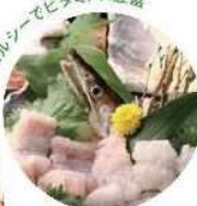
中津名物ほも Nabutan nabutan Homo