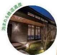
油断される鉄道遺産 鉄道のホテル 汽車ボッポ「別邸」 Kiryu-poppo Bettei