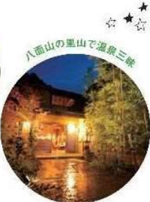
八高山の黒山で温泉三昧 お宿こがね山荘 Kogane-yama Suzuki Ryugasaki-kan