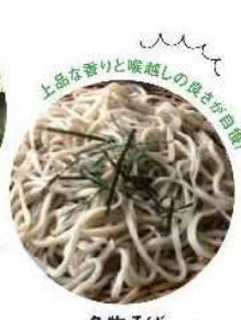
名物そば Nabutan Soba