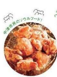
中津からあげ Nabutan Karage