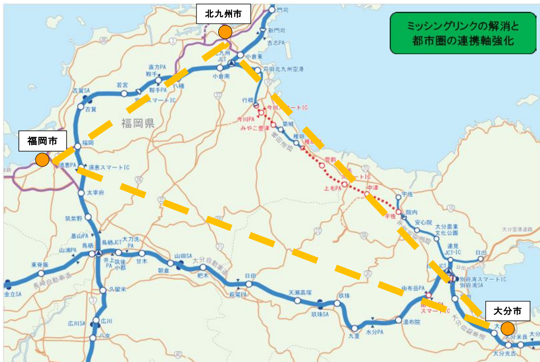
北九州市～豊前市間 時間短縮効果

今後、東九州自動車道が大分まで延伸した場合、北部九州のミッシングリンクが解消され、北九州市～大分市間の所要時間がすべて一般道路を利用した場合と比較し約95分間の短縮となり、福岡、北九州、大分都市圏の連携軸が強化されます。