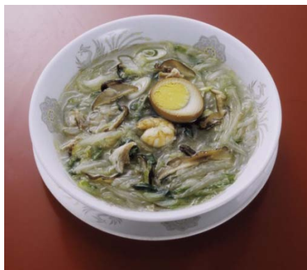
【 SA、PAでの熊本市の特産品・農産物などの物産フェアの開催 】 (太平燕等)