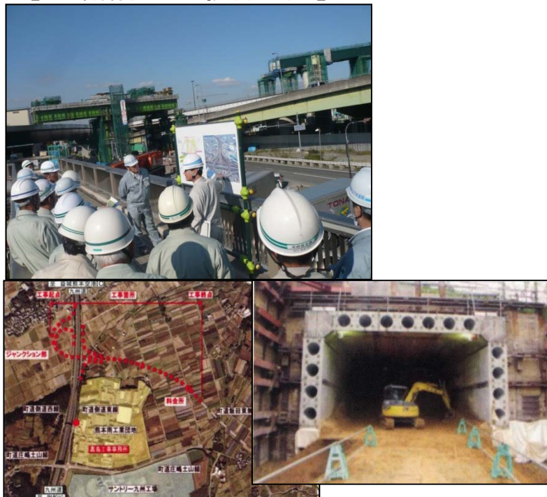
【現場講習会や技術交流】