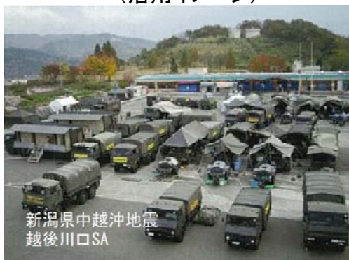
【SA・PAの防災拠点としての活用】 (活用イメージ)