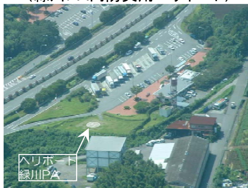
【SA・PAの防災拠点としての活用】 (緑川PA内防災用ヘリポート)