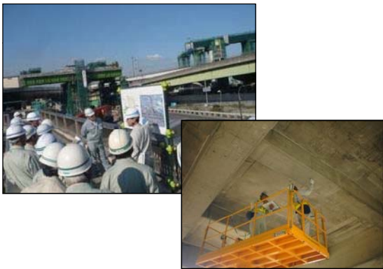
【 現場講習会や技術交流 】