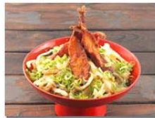
関門橋:壇之浦PA(下り線) 開運招福井