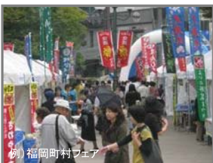
【観光イベント】 休憩施設等において共同開催