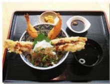
関門橋:めかりPA(上り線) 和布刈海峡井