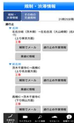
通行止め解除通知