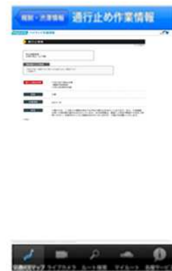
通行止め作業情報