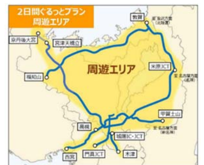
2日間プランの周遊エリア (普通車5,100円、軽自動車等4,100円)