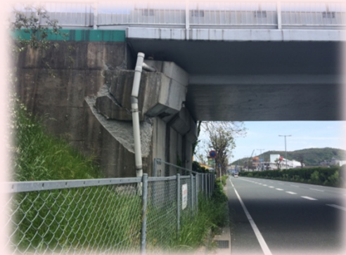
例) 一般道を移動中に発見した損傷