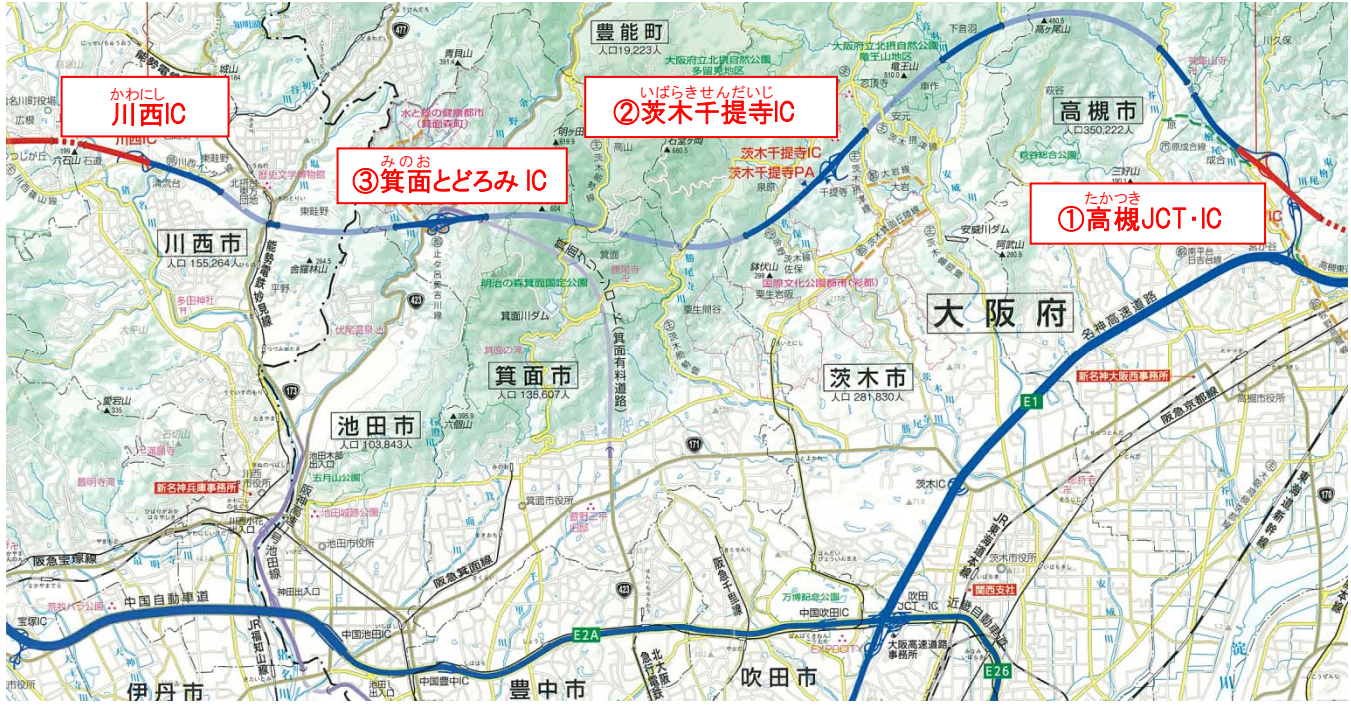
① たかつき 高槻JCT・IC