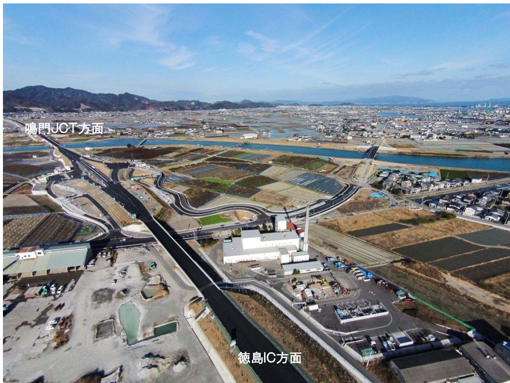
写真②【松茂パーキングエリア・スマートインターチェンジ付近 平成26年12月26日撮影】