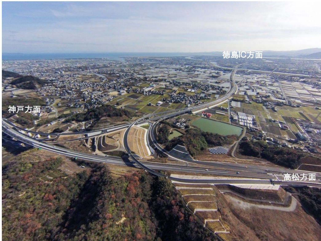
写真①【鳴門ジャンクション付近 平成26年12月26日撮影】