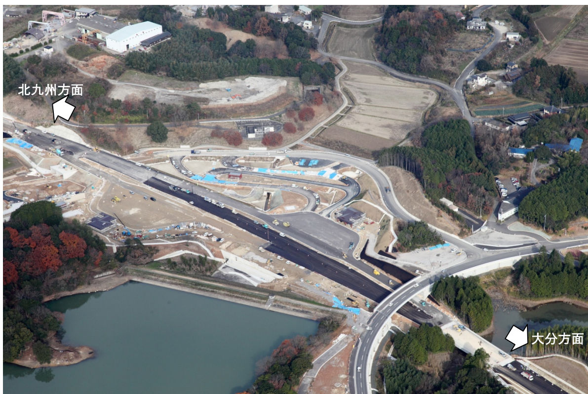
写真②【上毛パーキングエリア付近 平成26年12月25日撮影】