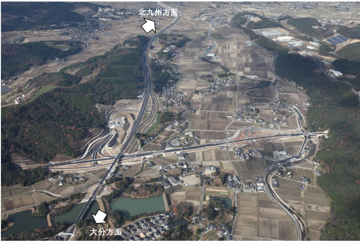
写真③【中津インターチェンジ付近 平成26年12月25日撮影】