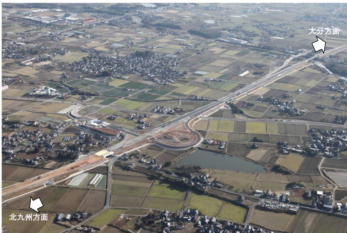
写真①【豊前インターチェンジ付近 平成26年12月25日撮影】