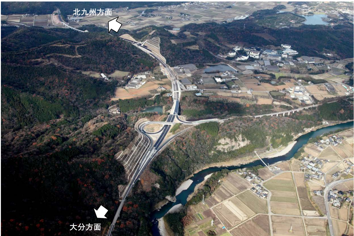
写真④【宇佐インターチェンジ付近 平成26年12月25日撮影】