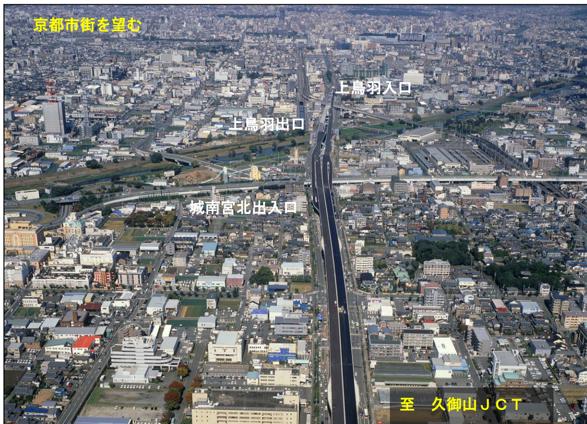
【京都線 城南宮北出入口北側付近 平成19年10月撮影】