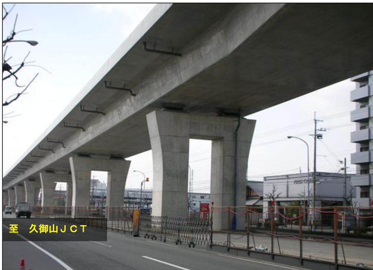
【第二京阪道路 巨椋池本線料金所上空 平成19年11月撮影】