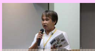
みつばや小城市羊羹製造本舗 小城市羊羹を熱く語る