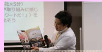
佐賀冷凍食品(株) 寿司からデザートまでご紹介!