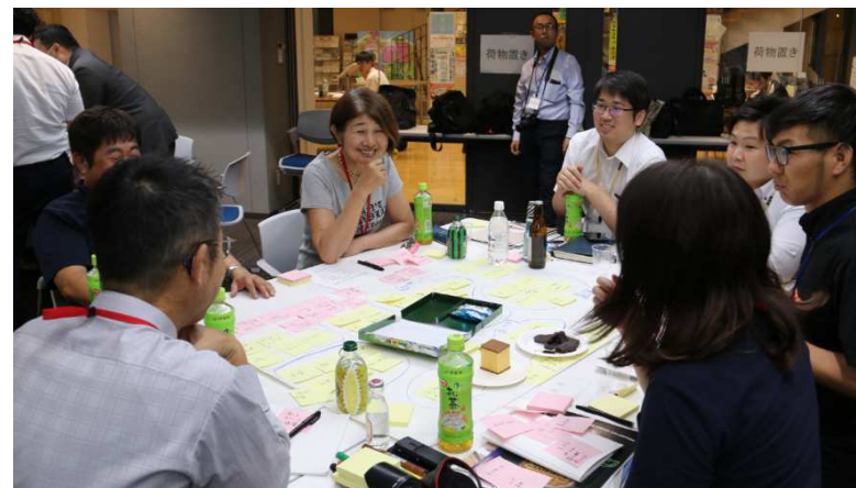
4つのグループに分かれ、みんなでアイデアを共有しました!