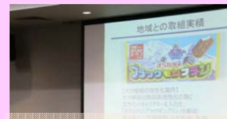
竹下製菓(株) これまでの多彩な取り組みを紹介