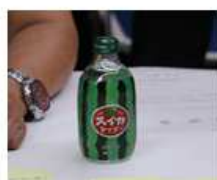
各企業の商品をみんなで試飲・試食しました!