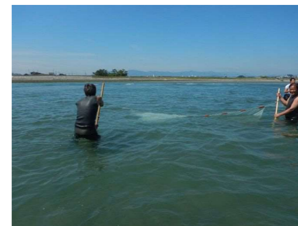
図 7.2-3 魚類調査の実施状況(左：刺し網、右：サーフネット)