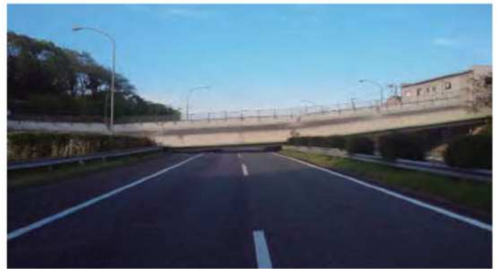
府領第一橋(落橋した直後の様子)