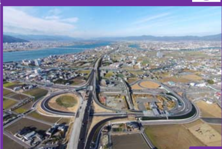
米津津波避難施設