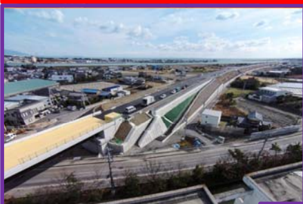
今切川に架設した橋（今切川橋）