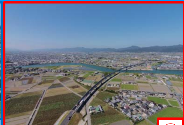
今切川に架設した橋（今切川橋）