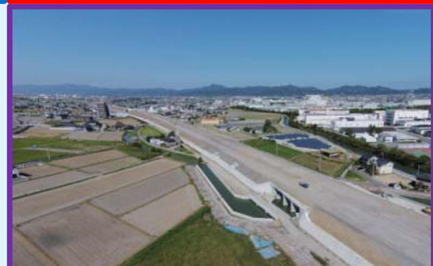
盛土を貫くための構造物 （カルバートボックス）