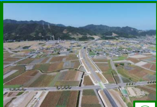
盛土（高速道路土台）