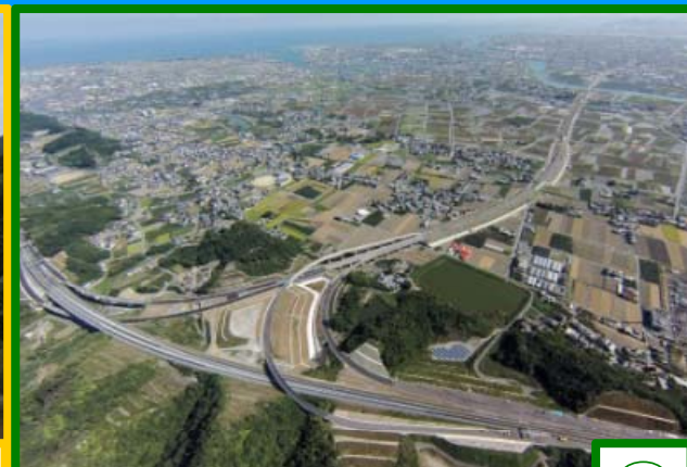
鳴門JCT（高松道接続部）