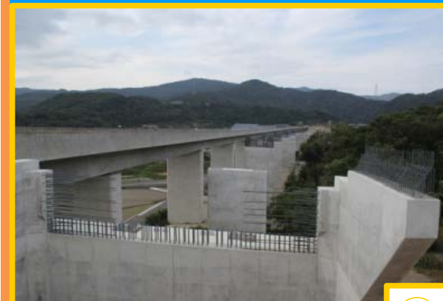
吹田高架橋（下部工）