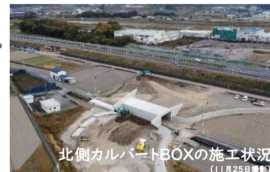
北側カルバートBOXの施工状況