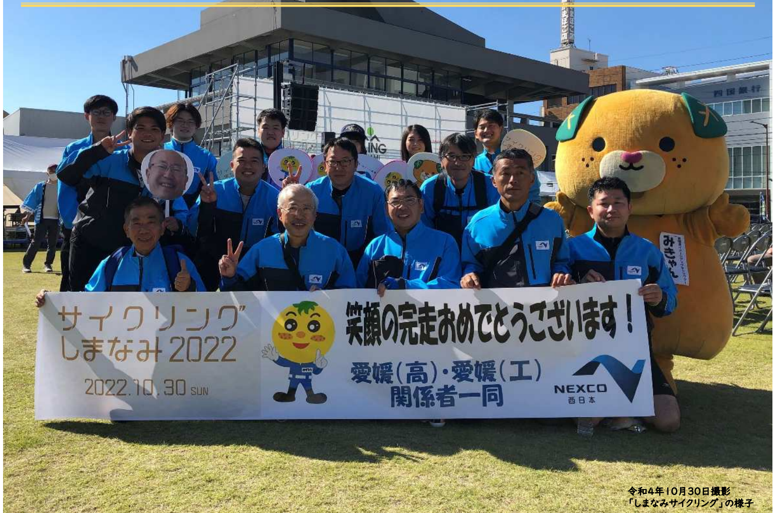
令和4年10月30日撮影 「しまなみサイクリング」の様子