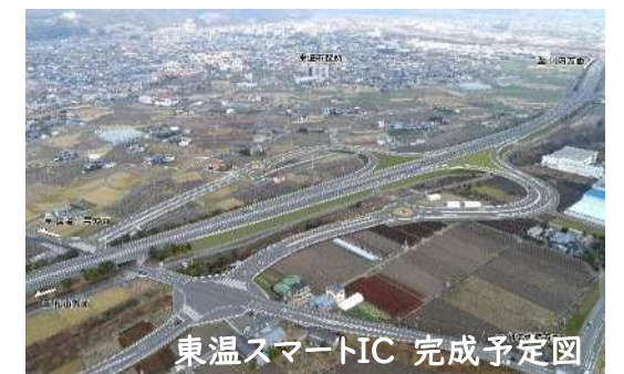
東温スマートIC 完成予定図