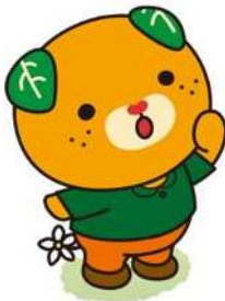
愛媛県イメージアップキャラクター みきゃん 許諾番号：410017