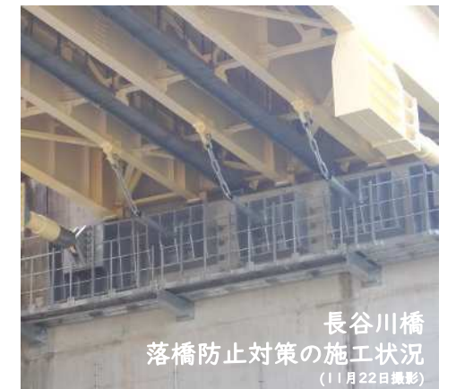
長谷川橋 落橋防止対策の施工状況