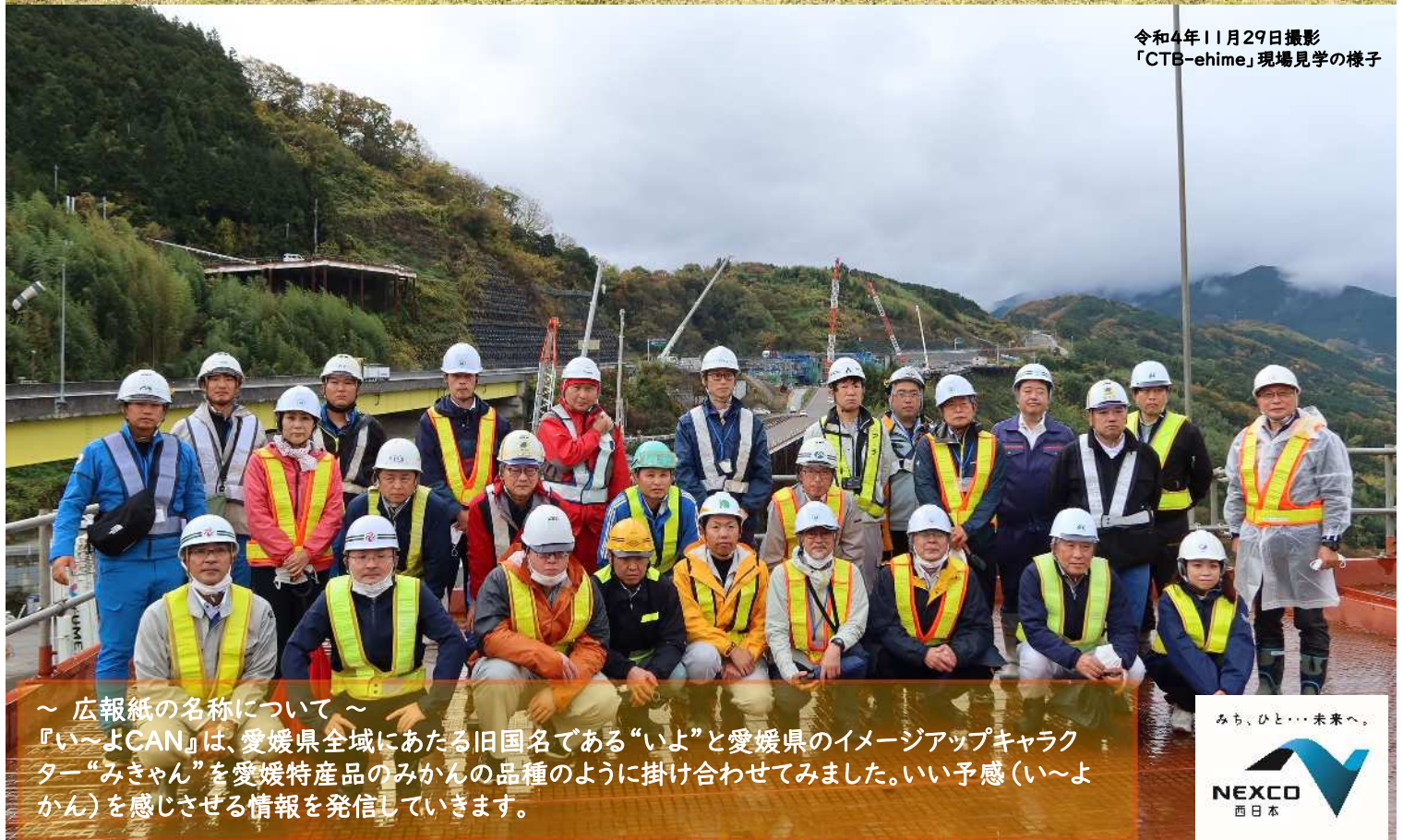
令和4年11月29日撮影 「CTB-ehime」現場見学の様子