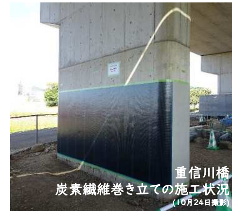
重信川橋 炭素繊維巻き立ての施工状況

耐震補強事業では、8工事を展開しています。本格的に工事が動き出した「重信川橋」や「長谷川橋」では、橋脚の補強や落橋防止対策を行っています。今後も引き続き、耐震補強が必要な橋脚では、鉄筋コンクリートや炭素繊維シートなどを用いて橋脚等の補強工事を行っていきます。