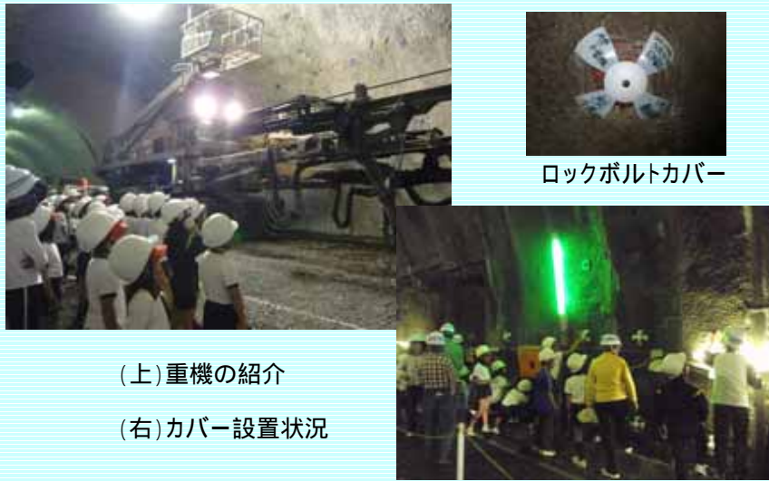
(上)重機の紹介 (右)カバー設置状況

平成22年5月30日、苅田町の新津トンネル工事現場で見学会を実施し、片島小学校の生徒約40名、保護者及び先生方約30名の、総勢約70名に参加頂きました。 建設中のトンネルの中を歩き、空間の広さや、温度を体感して頂いたり、切羽(掘削箇所)の付近では、掘削するための重機を動かして紹介致しました。 また、トンネルを掘削した後、トンネルを強くするためにロックボルトという鉄筋を打ち込みますが、そのロックボルトの先端にカバーを付けるという作業を生徒の皆さん一人一人に体験して頂きました。 将来このトンネルを通過する際に、トンネル建設のお手伝いをしたんだと思い出していただければと思います。