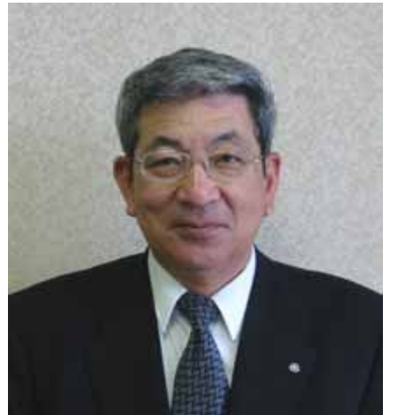
築上町 新川 久三 町長

暑中お見舞い申し上げます。 東九州自動車道は、九州縦貫自動車道及び九州横断自動車道と一体となり、九州を循環するハイウェイネットワークを形成し、東九州地域はもとより九州全体の発展に大きく貢献するものと期待されています。高速交通網の整備の遅れている東九州軸発展の根幹であり、取り分け圏域のさらなる発展をめざす京築地域にとりましては、人・物・情報の流れを一新し、文化・経済を活性化するために必要不可欠なものです。 本町におきましては、椎田道路の築城IC、椎田ICの改築工事も用地の取得がほぼ終了し予定どおり順調に進捗しております。また、椎田南IC(仮称)より大分県側になる本線区間につきましては、用地の取得も終わり上ノ河内川橋下部工事を発注、工事に入っております。 高速道路をはじめとする道路網の整備は、地域住民の生活に直結する切実な願いであり、これまで以上に地域を挙げて官民一体となり本事業に取り組んでいかなければなりません。 築上町としましても、福岡県、西日本高速道路株式会社、周辺自治体、地域住民と連携し、最大限の協力体制をとり東九州自動車道の早期完成に向けてがんばるとともに京築地域の発展に取り組んでいく所存です。