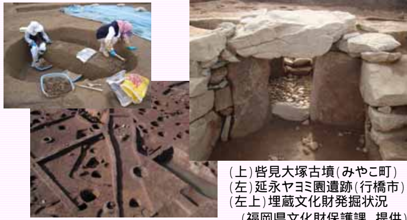
(上)皆見大塚古墳(みやこ町) (左)延永ヤヨミ園遺跡(行橋市) (左上)埋蔵文化財発掘状況

平成18年から実施している埋蔵文化財発掘調査は、現在順調に進捗しています。 今までに数々の遺構、土器等が発掘されましたが、その中でも、みやこ町皆見で発見された6世紀後半頃(古墳時代後期)のものと思われる「皆見大塚古墳」は、 ・xなどといった紋様が赤色で14箇所描かれた装飾古墳といわれ、福岡県東部での発見は珍しいとされています。 今後も埋蔵文化財発掘調査を引き続き進めて参りますので、地域の皆さまのご理解・ご協力をお願い致します。