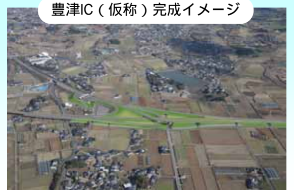
豊津IC(仮称)完成イメージ