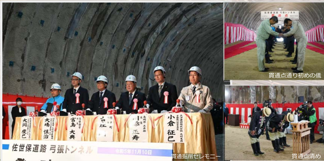
貫通点通り初めの儀