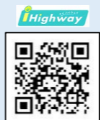
ハイウェイ交通情報ケータイサイト