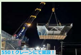
550tクレーンにて架設!

佐世保道路4車線化事業に伴い、佐世保みなとIC～佐世保大塔IC間に新たに2車線分の橋を架設する工事です。 この工事は、550tクレーンで桁を吊り上げ、ベント（桁を仮置きする支柱）へ桁を乗せて支えながら順次、架設を進めていきます。