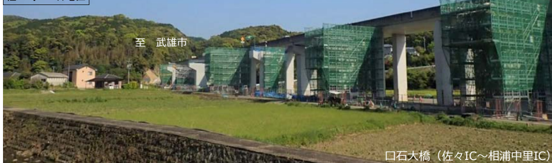
口石大橋（佐々IC～相浦中里IC）