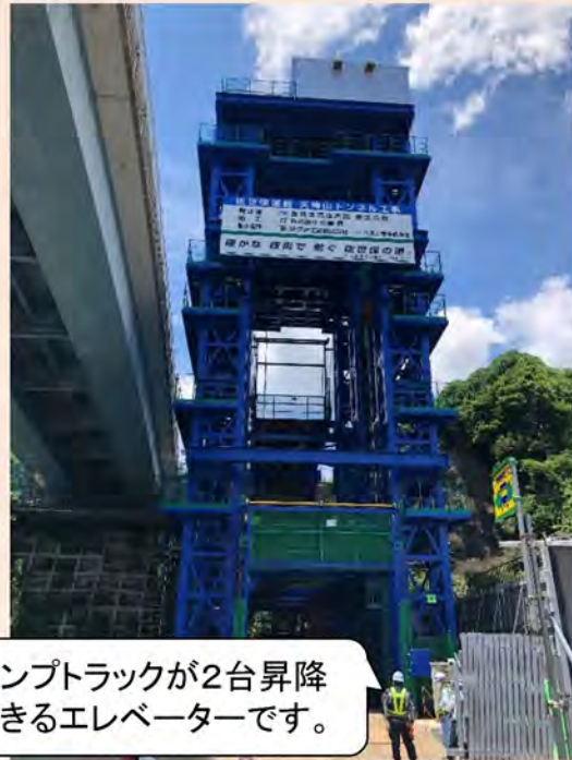
ダンプトラックが2台昇降できるエレベーターです。