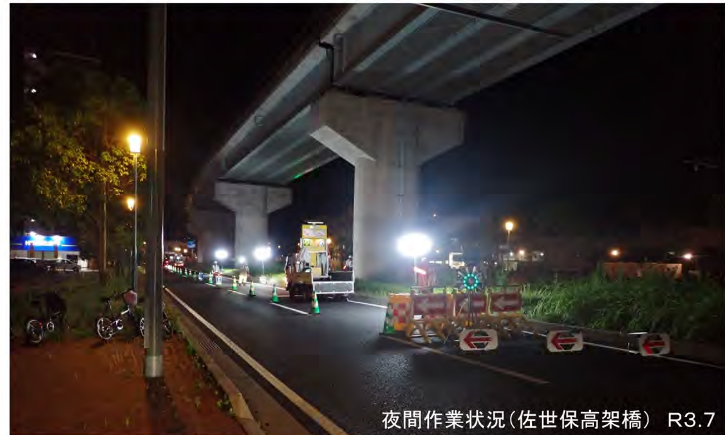
夜間作業状況(佐世保高架橋) R3.7

夜に、ご不便おかけいたします 9月より高速及び高速高架下県道の夜間通行止めをします