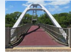
アルパカーキ橋(奥は佐世保公園)

1966年(昭和41年)11月1日、佐世保市と姉妹都市の提携をいたしました米国ニューメキシコ州アルパカーキ市との末永い友好の絆となり、日米親善の架け橋となることを願い橋名を「アルパカーキ橋」と命名されました。