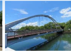
佐世保川に架かるアルパカーキ橋