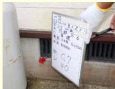
家屋調査事例(外部調査状況)

4車線化事業に伴い今後トンネルの新設工事を予定しています。トンネル工事に先立ち、万が一に備えて皆様の家屋等の状況を把握するために家屋事前調査をさせていただきます。皆様にはご迷惑をおかけいたしますが、ご理解・ご協力をお願いいたします。