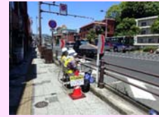
交通量調査状況(昼)

沿線の皆様のご理解・ご協力のもと、無事調査が完了いたしました。ありがとうございました！