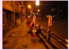
交通量調査状況(夜)