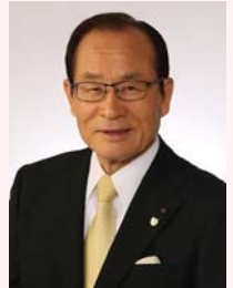
佐世保市長 朝長 則男

地元自治体としましては、改めて円滑な事業進捗が図られるよう尽力してまいりたいと思っております。