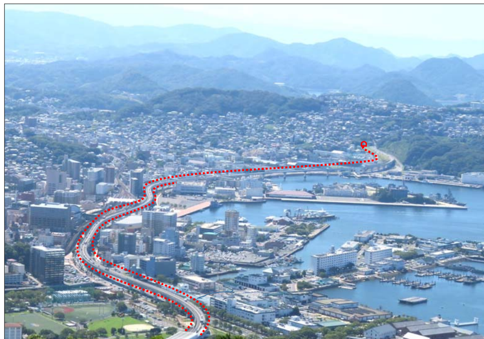
(赤線は4車線化計画線です)