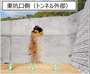
東坑口側（トンネル外部）

西九州自動車道（佐々IC～佐世保大塔IC間）4車線化事業のうち、令和2年12月より掘削を進めてまいりました、相浦中里IC～佐世保中央IC間に位置する「弓張トンネル（全長2,671m）」が、このたび、令和5年10月10日に貫通いたしました。