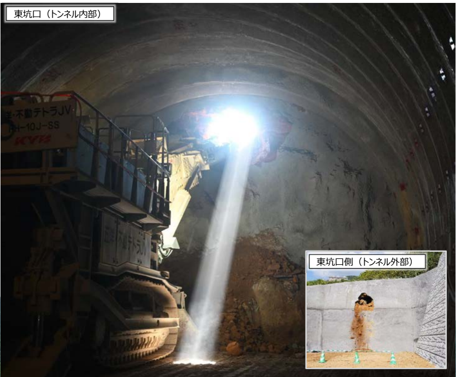
東坑口（トンネル内部）