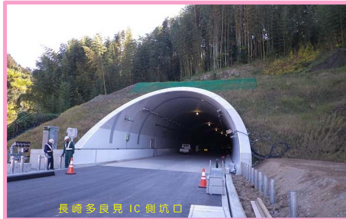
長崎多良見 IC 側坑口

*2トンネル 工事しゅん功* 平間トンネル工事、中里トンネル工事がしゅん功しました。