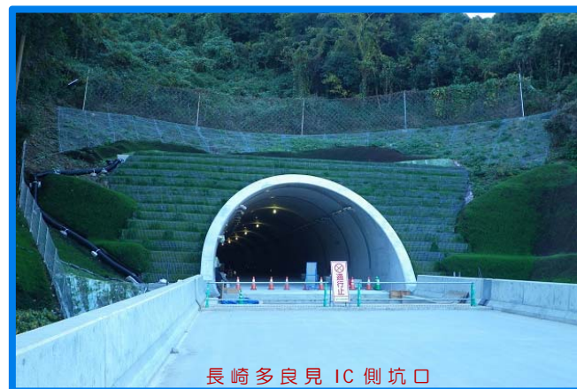
長崎多良見 IC 側坑口