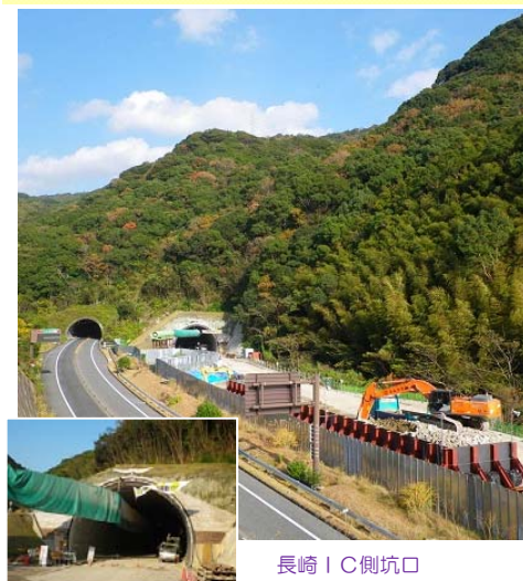
長崎 IC 側坑口

長崎トンネル（長崎早坂町～芒塚町）の掘削を行っています。 芒塚 IC橋の下部工事も着手し、工事を進めています。