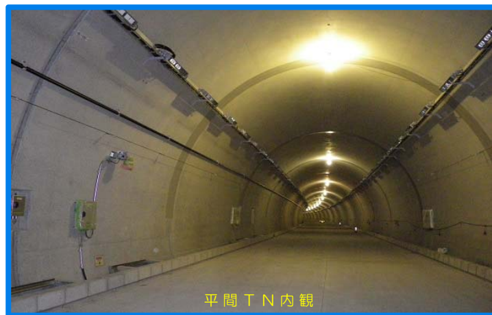
平間 T N 内観