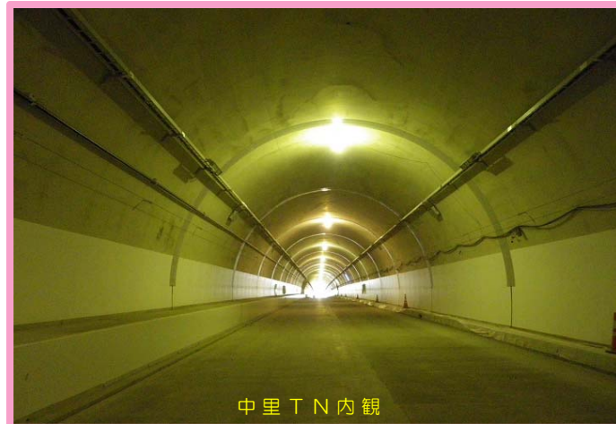
中里 T N 内観