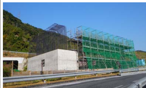
芒塚 IC 橋 (下部工) 工事 現況

24時間の高速道路の道路交通情報を提供しています。下記のアドレスを直接入力するか、QRコードからアクセスしてください。