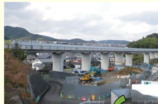
H26.7撮影 → 橋台、橋脚施工中