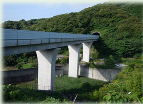
中里トンネル、清水川橋付近現況写真

平成27年1月15日に芒塚地区(中尾トンネル工事)、3月4日に平間地区(平間橋(下部工)工事・現川橋(下部工)工事)の地域の代表者の皆様へ工事説明会を開催し、工事の概要や内容について説明を行いました。