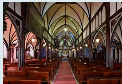
*大浦天主堂内覧*

長崎県内では多くの教会とキリスト教に関する史跡があります。1550年に長崎県平戸にキリスト教が伝来し、繁栄、弾圧、禁教・海禁(鎖国)により250年以上にもおよぶ潜伏を経て、ひそかに信仰を継承した信徒たちにより建てられた教会群は、長崎におけるキリスト教の歴史を現代へ伝える、重要な資産となっています。日本最古の教会堂であり、国宝に指定されている大浦天主堂を含む14資産(長崎県・熊本県)で構成される「長崎の教会群とキリスト教関連遺産」は、平成28年の世界遺産への登録を目指しています。西洋と日本の建築文化と技術が融合された教会群は、周囲の環境となじみすばらしい景観をつくりだしています。ぜひ一度巡ってみてはいかがでしょうか。