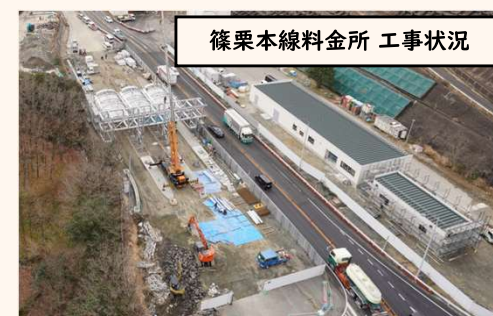
篠栗本線料金所 工事状況