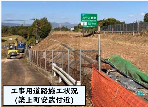
工事用道路施工状況 (築上町安武付近)