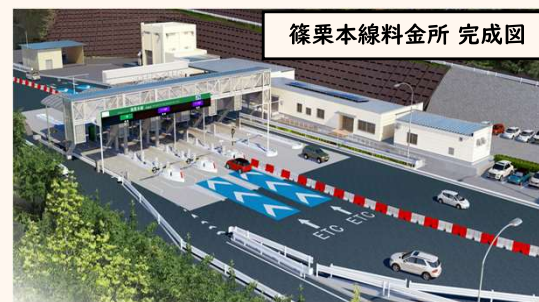
篠栗本線料金所 完成図

通行料金は、1回走行あたり下記の通行料金を篠栗本線料金所においてお支払いいただけます。