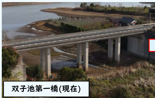
双子池第一橋(現在)