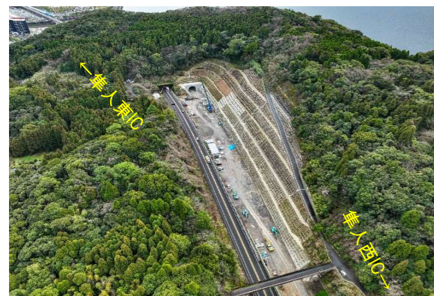
①野久美田トンネル西坑口付近