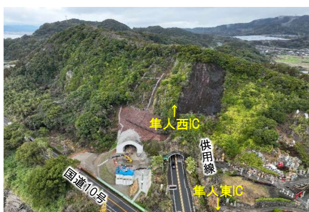
②野久美田トンネル東坑口付近