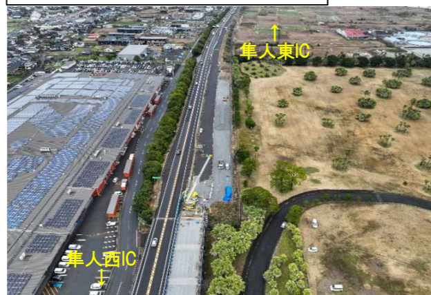
④隼人東～隼人西 土工部