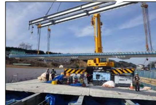
・新しいコンクリート床版の設置状況