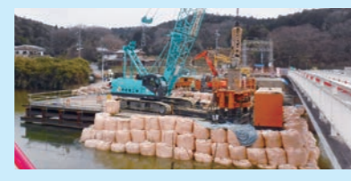
「荒戸橋」の橋脚の基礎工事実施中です

当該区間のサービスエリアには、スマートインターチェンジも併設して計画(平成26年8月連結許可)、構造物(橋梁、トンネル)比率は、約4割で山間部を通過する計画です。延長の約5割にわたり自然公園特別地域、砂防指定地及び保安林が指定されており、埋蔵文化財も点在しています。